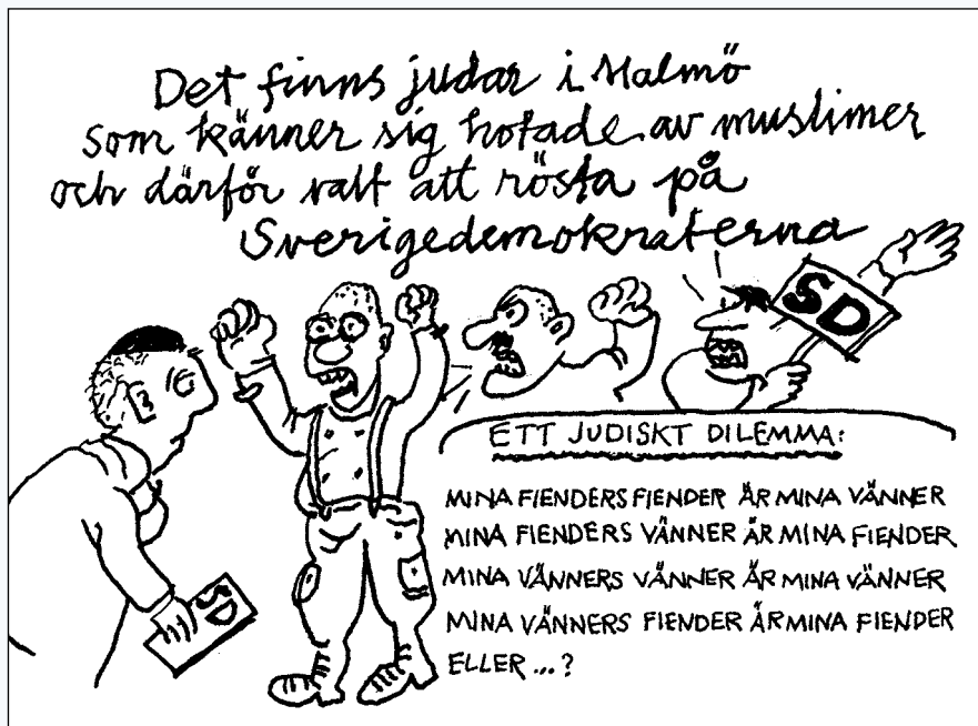
Leif Nelson: Streck i kanten