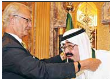
Saudiarabiens Abdullah tar emot en förtjänstmedalj av sin svenska kollega.

Att det i Saudiarabien varken finns religions- eller yttrandefrihet, varken politiska partier eller fri press, att otrogna kvinnor stenas, tjuvar straffas med handamputation, homosexuella döms till spöstraff och kvinnor förbjuds att köra bil har självfallet inget med frågan om diktatur eller mänskliga rättigheter att göra. Fråga kungen!