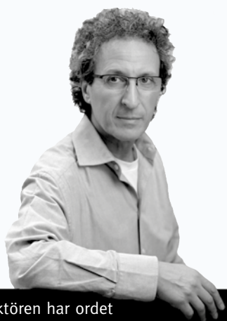
Chefredaktören har ordet

M assmordet i Utøya i somras har väckt många frågor där begreppet "ondskan" används för att beskriva det obeskrivliga och ofattbara.