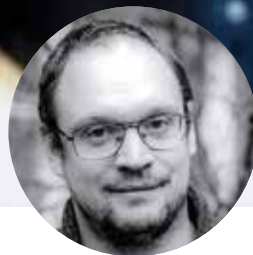
JONATAN UNGE programledare

"Ett väldigt, väldigt gammalt testamente på ett helt nytt sätt." Lyssna på judiskekronika.se