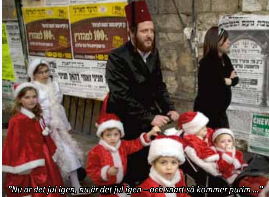
”Nu är det jul igen, nu är det jul igen – och snart så kommer purim...”