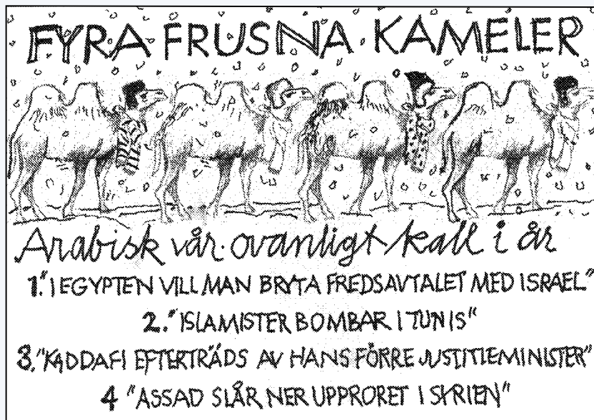
Leif Nelsson: Streck i kanten