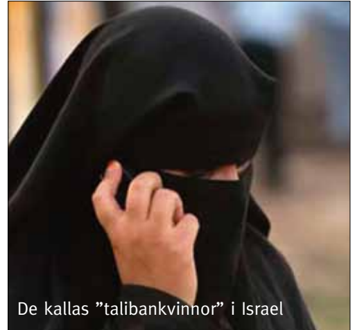
De kallas ”talibankvinnor” i Israel

• Puah-institutet för medicin och halacha , som hjälper religiösa par med fruktbarhetsproblem, anordnade i höstas en konferens i Jerusalem. Trots ämnet – och trots att detta utspelar sig i en modern stat på 2000-talet – fick kvinnor inte närvara. Några manliga ultraortodoxa deltagare ansåg det vara i