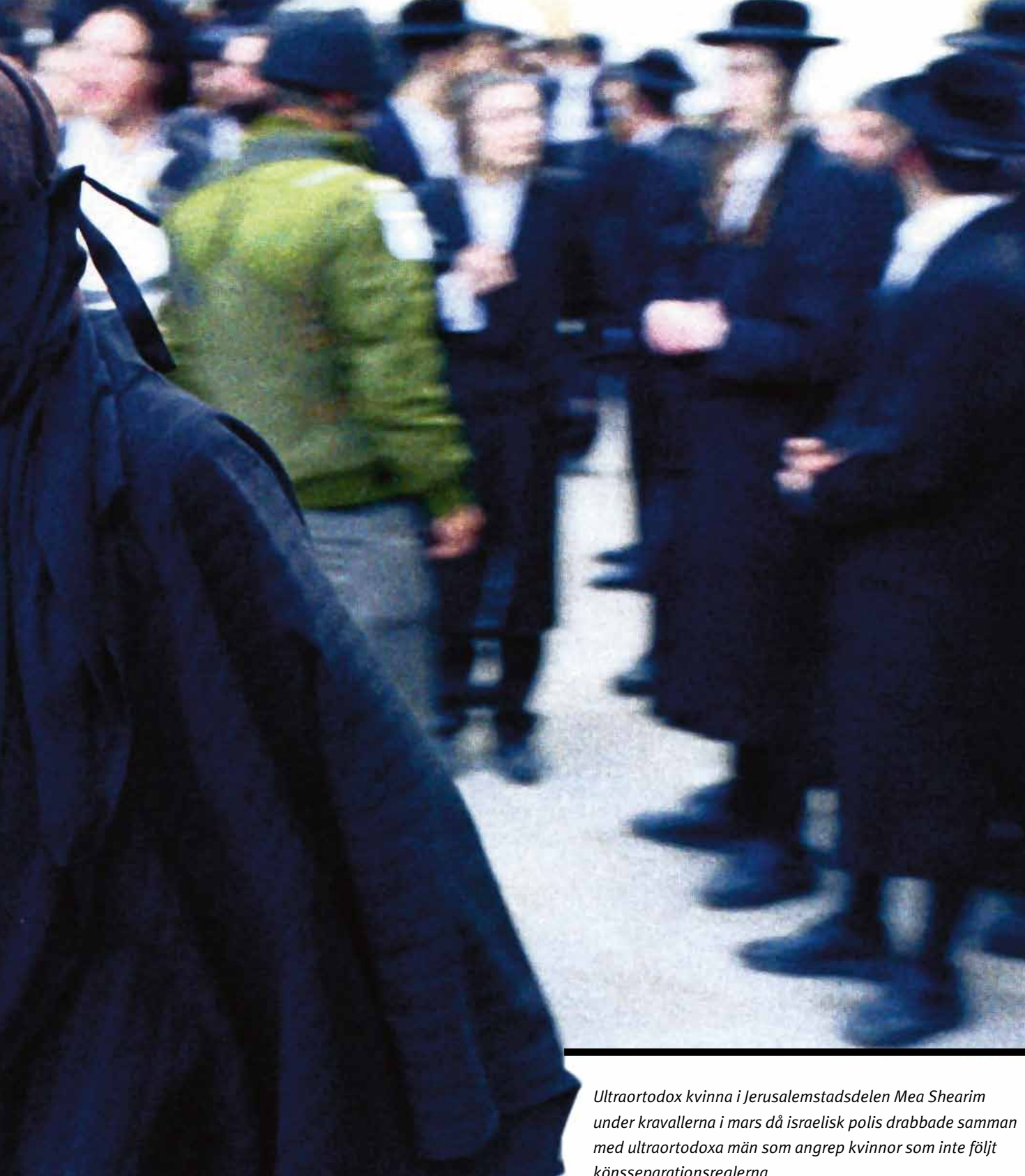
Ultraortodox kvinna i Jerusalemstadsdelen Mea Shearim under kravallerna i mars då israelisk polis drabbade samman med ultraortodoxa män som angrep kvinnor som inte följt könsseparationsreglerna.

Kvinnobilder har nästan försvunnit från gatorna i Israels huvudstad. Kvinnor har förvisats till särskilda trottoarer. Bussar och sjukvårdskliniker har blivit könssegregerade och militären har övervägt att ge kvinnliga frontsoldater nya uppgifter därför att religiösa män inte vill tjänstgöra tillsammans med dem. Sådan är den nya verkligheten i 2000-talets Israel där ultraortodoxa rabbiner försöker hindra – ibland med våld – sekulära värderingar från att