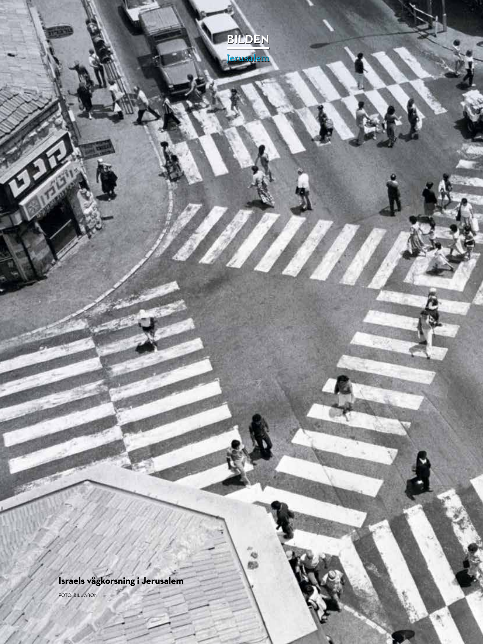
Israels vägkorsning i Jerusalem